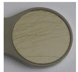
Bild 1 Kratzer/Putzstreifen

Beachten Sie bei der Montage des Mundspiegels auf einen Griff, dass insbesondere beim abschließenden Festdrehen des Mundspiegels sehr hohe Kräfte entstehen, die die Schweißung negativ beeinflussen können, sollte die Kraft auf diese wirken. Halten Sie deshalb den Mundspiegel nicht an der Fassung sondern immer am Stiel. So können Sie den Griff aufdrehen und auch mit einer letzten, sehr festen Drehung das Gewinde fest anziehen, ohne dabei die Schweißung und/oder die Fassung zu beeinträchtigen/deformieren und damit den festen Halt des Spiegels zu gefährden. (Bild 3+4+5)