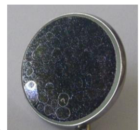
Bild 2 Kalkflecken